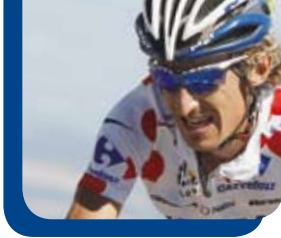
Franco Pellizotti , Gewinner des Bergtrikots Tour de France 2009 King of the Mountains Jersey Winner in the 2009 Tour de France